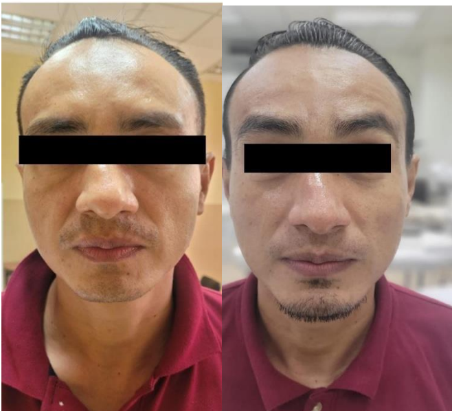
Figura 3. Caso # 3 antes y después del tratamiento.

Al final del tratamiento el rostro se observa menos graso, disminución de las manchas y cicatrices