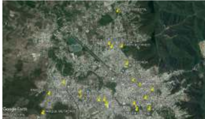
Imagen #4 Ubicación de los parques urbanos en Portoviejo