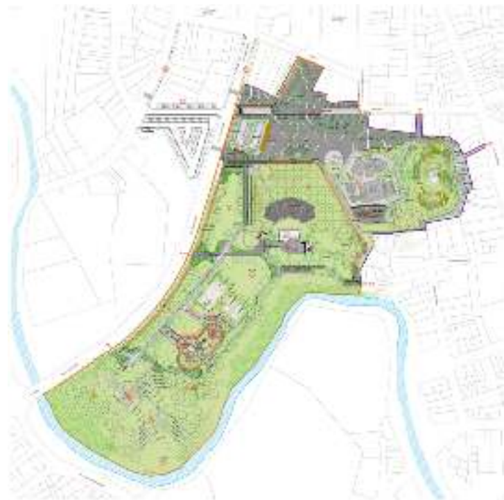
Imagen #3: plano general del parque Las Vegas