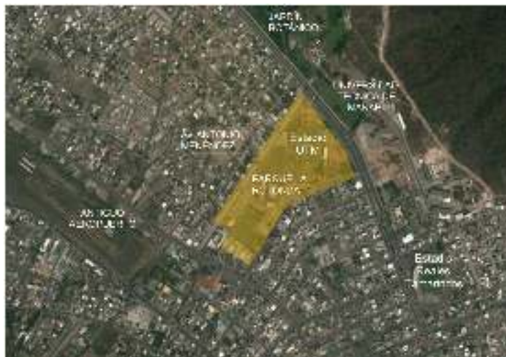
Imagen #2: Vista satelital del parque La Rotonda

La idea urbanística fundamental, ha sido construir un equipamiento recreativo con actividades diversas, que convoque a los habitantes de la ciudad de todos los sectores, a pesar de que su ubicación favorece a los asentamientos ubicados en el costado N. y O. de la urbe. QUIZAS y no es necesariamente un parque diseñado para las personas de la tercera edad, pero aun así el parque cumple satisfactoriamente con ciertos requerimientos de accesibilidad universal que sin lugar a duda favorece a la población adulta mayor de nuestra ciudad.