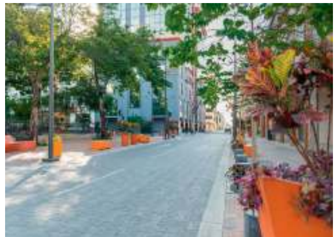
Imagen #5 R. U. nótese la amplitud de las aceras