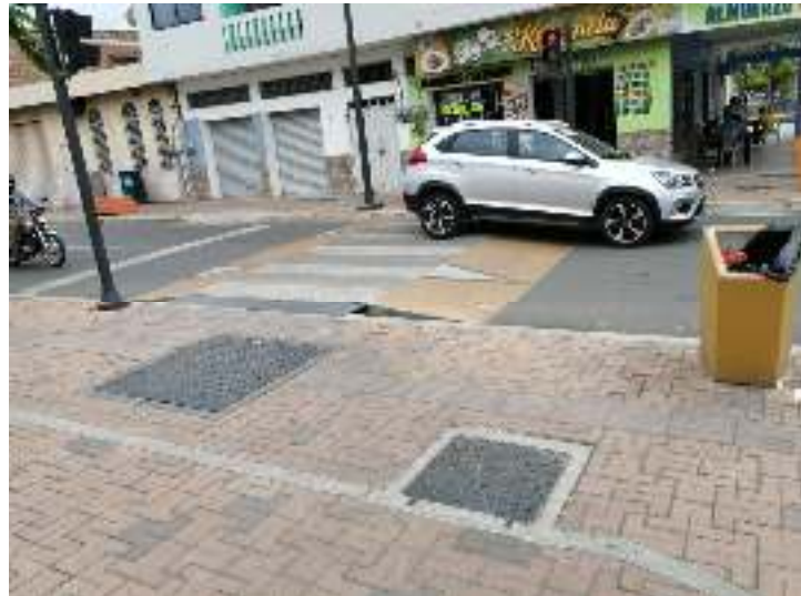
Imagen # 7 Del lado del parque Las Vegas no existe desnivel entre calzada y acera solo bolardos que efectivizan la división.

Imagen #8 en los lugares en donde si existe desnivel se soluciona con grandes muros que van de un lado a otro para lograr se facilite el cruce al peatón.