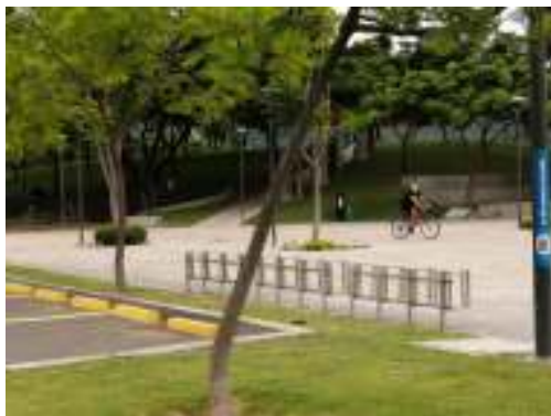
Imagen #11 Grandes plazas y áreas verdes

Los 4600 árboles plantados en las 11 hectáreas de construcción conforman el nuevo pulmón de la ciudad de Portoviejo. Las instalaciones beneficiarán a 250 mil habitantes, logrando la integración familiar. Sin mostrar mayores detalles de caminerías, rampas para las personas con movilidad limitada e incluso parqueaderos con áreas de minusvalías, sin embargo, un ambiente familiar siempre cuenta con el espacio para el abuelo.