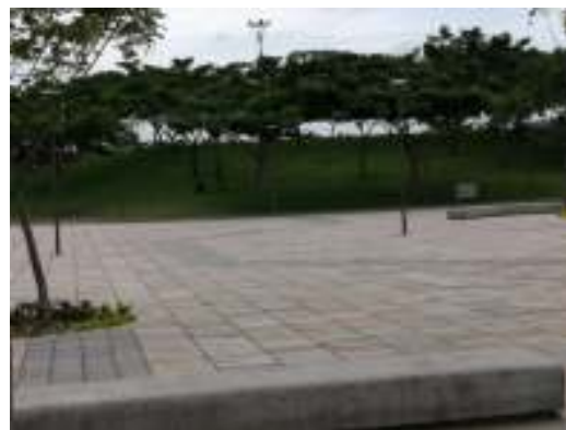
Imagen #12 Cero barreras arquitectónicas

Grandes áreas boscosas, con rampas de acceso hasta en los lugares menos esperados hacen también de este espacio un lugar acogedor para la convivencia y la integración familiar que incluye a un adulto mayor.