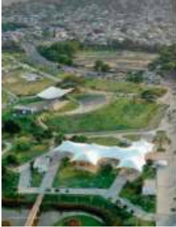
Imagen #13 Vista aérea del Parque Las Vegas

Amén de esta realidad se entrevistó a un grupo de 50 personas de la tercera edad sobre la reforma de la ciudad y las facilidades que presenta para las personas longevas y las respuestas fueron las siguientes: