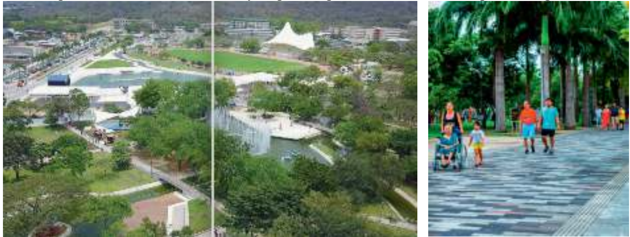
Imagen #9 Vista aérea de La Rotonda, grandes plazas, grandes espacios verdes, gran laguna.

El Parque además posee accesos para las personas con movilidad limitada, un centro de atención de salud primaria con un desfibrilador y respirador para la atención de cualquier emergencia.