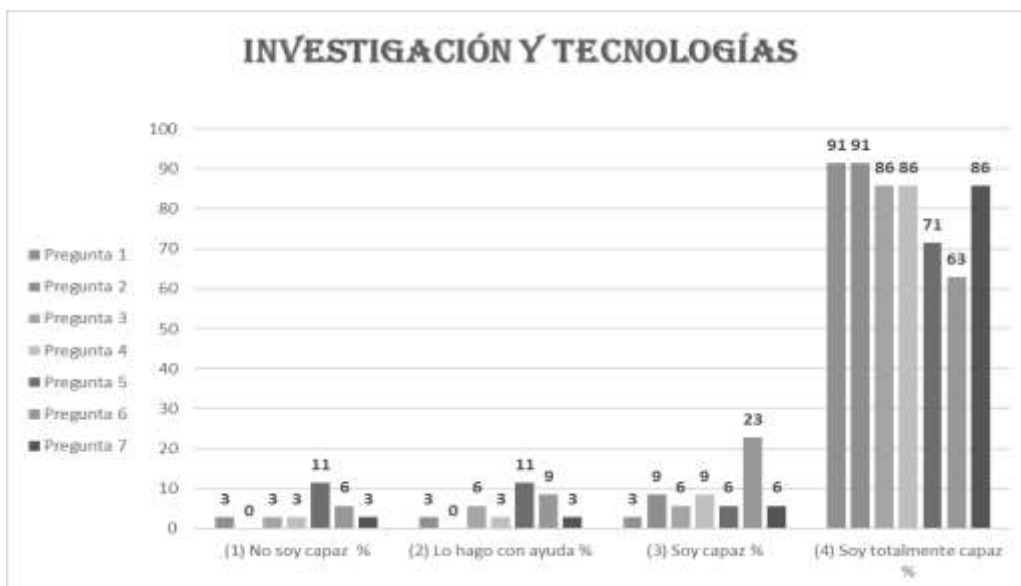
Figura 3: Investigación y tecnologías para el aprendizaje de las Ciencias Naturales

Dentro de las capacidades evaluadas se puede mencionar las habilidades con las que cuentan en la actualidad los estudiantes al realizar sus trabajos investigativos para adquirir nuevos conocimientos utilizando los diferentes medios tecnológicos que les permiten nutrirse y afianzar sus saberes a través de la tecnología.