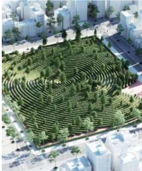
Figura 3. El parc de la Distance, (Anexos)

https://www.admagazine.com/arquitectura/parc-de-la-distance-asi-seran-los-parques-despues-del-covid-19-20200521-6852-articulos.htm