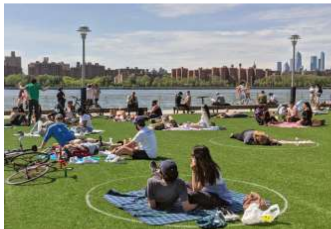
Figura4. Espacio Público. Domino Park Brroklyn, New york

https://untappedcities.com/2020/05/18/ph