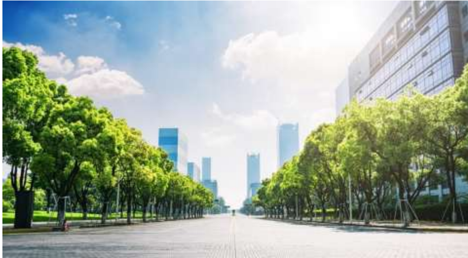
Figura 1. Ciudad Post Pandemia

https://www.lavoz.com.ar/espacio-de-marca/ciudades-post-pandemia-como-podria-cambiar-diseno-urbano