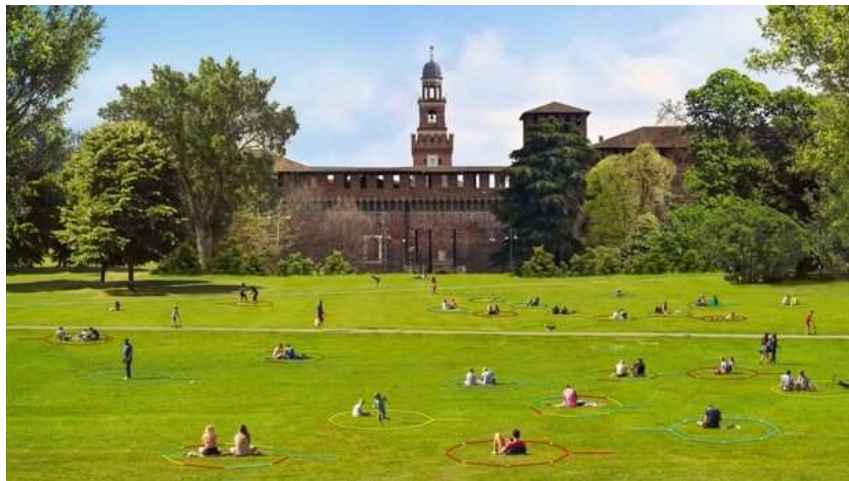
Figura 2. C'entro

https://diariodesign.com/2020/05/top-10-arquitectura-y-diseno-contra-el-coronavirus/