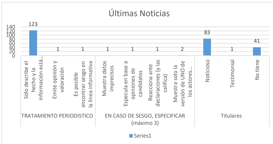
Gráfico 1. Tratamiento periodístico, sesgo y titulares caso de estudio medio digital Últimas Noticias de la ciudad de Portoviejo.